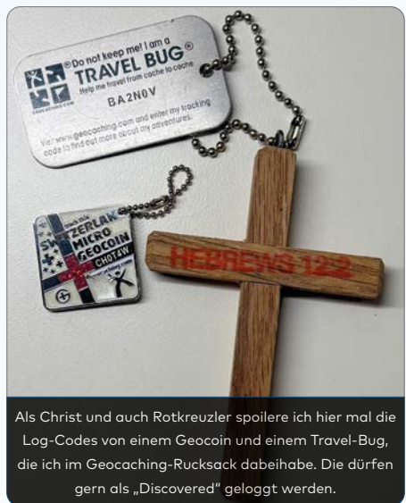
Als Christ und auch Rotkreuzler spoilere ich hier mal die Log-Codes von einem Geocoin und einem Travel-Bug, die ich im Geocaching-Rucksack dabei habe. Die dürfen gern als „Discovered“ geloggt werden.