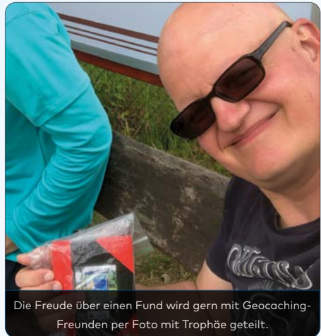
Die Freude über einen Fund wird gern mit Geocaching-Freunden per Foto mit Trophäe geteilt.

alias Onkel Tube, wir schauen auf fast 5.000 Funde in 10 Ländern