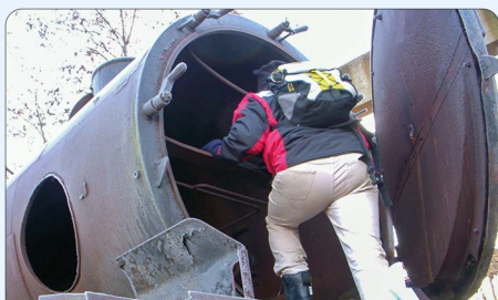
Eine eindrucksvolle Herausforderung ist Geocaching an Lost Places wie hier an einer alten Dampflokomotive.

Gleich am nächsten Tag hab ich mir diese Internetseite angesehen. Nach der nötigen Anmeldung konnte ich mir in der Umgebungskarte Geocache-Verstecke anzeigen lassen. Und nach Studium der Beschreibung zu einem Versteck in Königshain