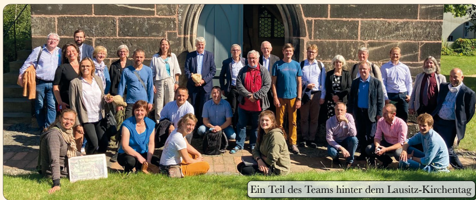
Ein Teil des Teams hinter dem Lausitz-Kirchentag