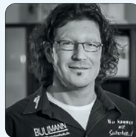
Ihr Robert Bullmann Fachgeschäft für Sicherheitstechnik

Ein Tipp von uns: Sollte es ihnen auch einmal passieren, dass die Wohnungs- oder Haustür zufällt oder der Schlüssel verloren geht, wählen sie immer ein ortsansässiges Unternehmen. Idealerweise suchen sie sich eine Firma ihres Vertrauens aus und speichern deren Telefonnummer im Telefon oder Notizbuch. Dann kommt zum Tür-Zu-Schreck nicht noch der Finanzschock hinzu!